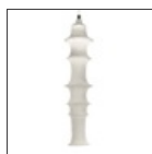
Maglia ignifuga 165 + cerchi inox DS2040CRCI