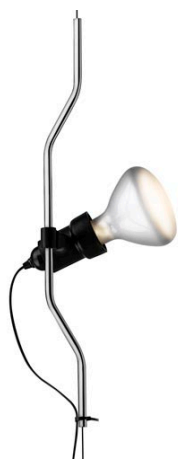
F5700058 Parentesi dimmer elemento complemento - Nichel